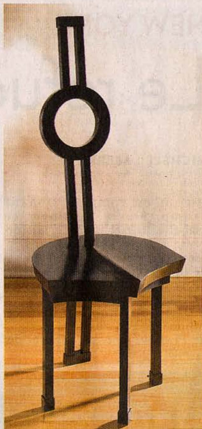
Chaise africaine, modèle Mursi.